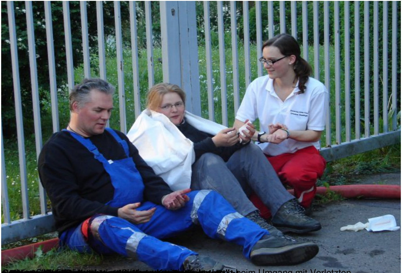
Einstieg in die Arbeit mit Verletzten